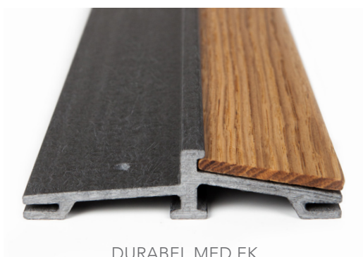
DURABEL MED EK