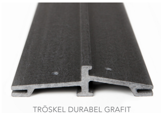
TRÖSKEL DURABEL GRAFIT

Plåt monteras enligt bild. Plåten behöver inget omvik om den monteras med lim och medföljande gummipads. I spåret skall limmas med MS lim. Färglöst MS lim finns på Ekstrands.