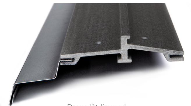
Dropplåt limmad mot Durabel tröskel