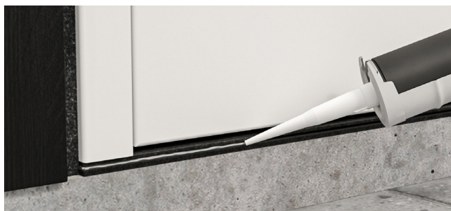
Lägg en limsträng med silikon eller MS-lim i tröskelns skåra på utsidan.