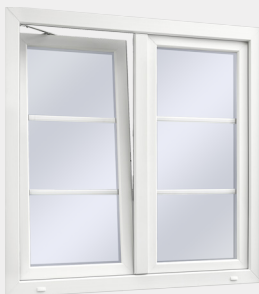
PVC DREH-KIP VÄDRING