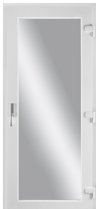
PVC FÖNSTERDÖRR UTÅTGÅENDE