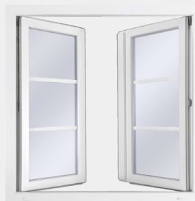
PVC DREH-KIP ÖPPET