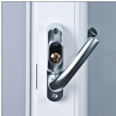
Uppställning i önskad vinkel