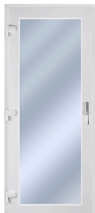
UTÅTGÅENDE FÖNSTERDÖRR SEDD UTIFRÅN, VÄNSTERHÄNGD.

Hängningen anges alltid från den sida man kan se gångjärnen. Ett högerhängt fönster har alltså gångjärnen på höger sida och vice versa. På inåtgående fönster anges hängningen sedd från insidan, på utåtgående fönster anges hängningen från utsidan.