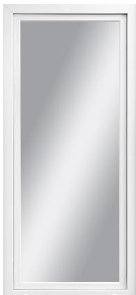
PVC FÖNSTERDÖRR INÅTGÅENDE